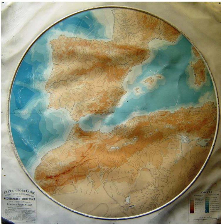
Figura 1: Élisée Reclus e Emile Patesson, Carta Globular do Mediterrâneo Ocidental (Bruxelas, 1903)

UM DOS DISCOS GLOBULARES EXISTENTES NA BGE (BIBLIOTECA DE GENEBRA, DEPARTAMENTO DE CARTAS E PLANOS), FEITO EM ALUMÍNIO, ESCALA DE 1 : 5 000 000.